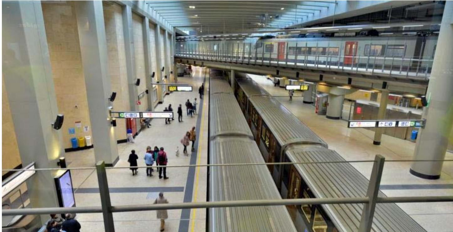
La gare Schuman est un modèle à suivre en matière d'intermodalité, soulignent les auteurs de l'ouvrage.

L'ouvrage va à cet égard à l'encontre d'une idée reçue. Bruxelles n'a pas besoin d'un « vrai » métro efficace, qui relève du « fantasme », écrit en