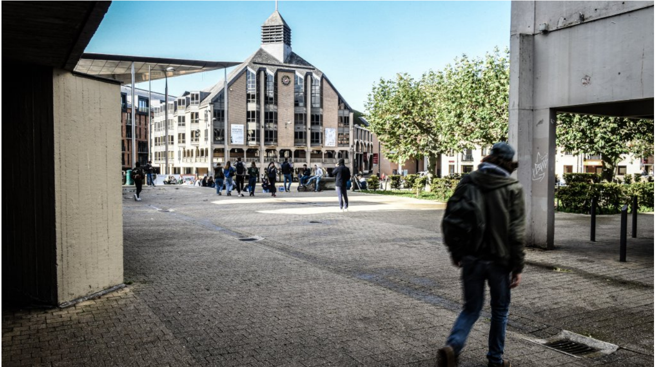
La Grand Place de Louvain-la-Neuve. La cité universitaire accueille 55.000 personnes en journée.

FRANÇOIS-XAVIER LEFÈVRE | 04 février 2023 01:10